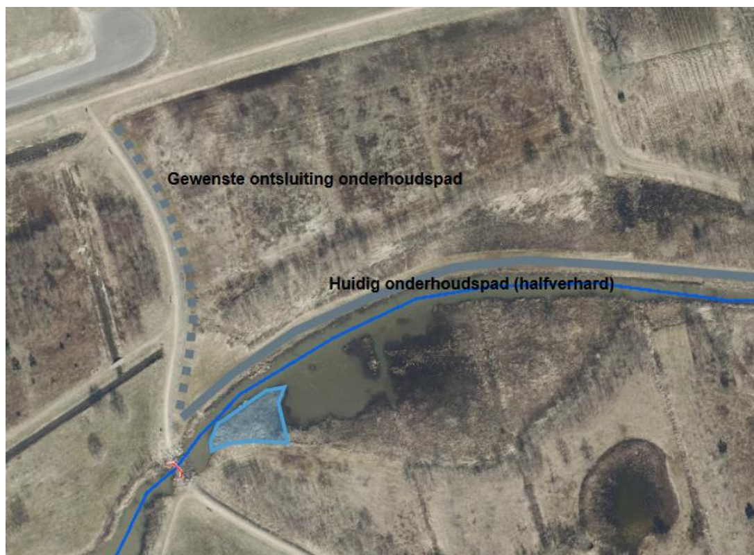
Schets te realiseren ontsluiting onderhoudspad

Vanuit het waterschap is er de wens om de vrijgekomen grond toe te passen ter verbetering van de toegang tot het gebied en een aanrijroute te creëren. Deze gewenste route loopt vanaf de Rumbastraat parallel aan de aanwezige kade naar het bestaande half verharde onderhoudspad dat langs de waterpartij aanwezig is (zie onderstaande figuur). Het is niet de bedoeling om hier een echt verhoogd pad te creëren, maar het gaat om een (onverharde) strook die net iets boven het huidige maaiveld (huidige maaiveldhoogte circa NAP +5,3 m) ligt en daardoor beter berijdbaar is. De gemeente is akkoord met de aanleg van de ontsluiting van het onderhoudspad.