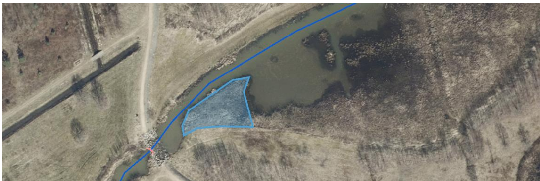
Te ontgraven deel plas-dras zone

Zoals besproken is het voorstel om de in onderstaande figuur aangegeven hoek af te graven tot een diepte van circa 30 à 40 cm onder het waterniveau. Deze hoek heeft een oppervlakte van circa 290 m 2 , daarmee komt circa 100 m 3 grond vrij.